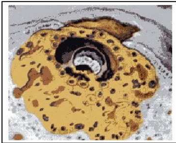
9 dagen oude eicel