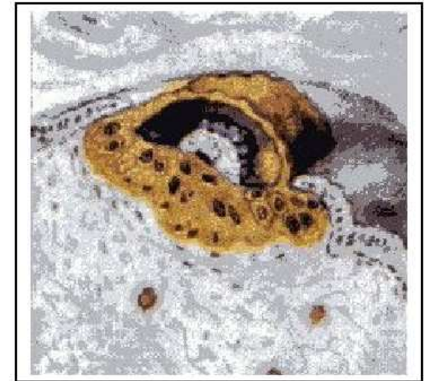
7 dagen oude, half ingenesteld ei. De trofoblast aan de embryonale pool van de blastocyste is in de cytotrofoblast en de syncytiotrofoblast gedifferentieerd.