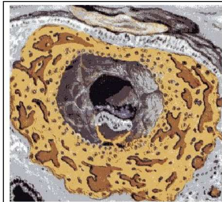
11 dagen oud, volledig ingenesteld ei. Het baarmoederslijmvlies is opnieuw helemaal toegegroeid. In de trofoblast hebben zich bloedvaten gevormd.